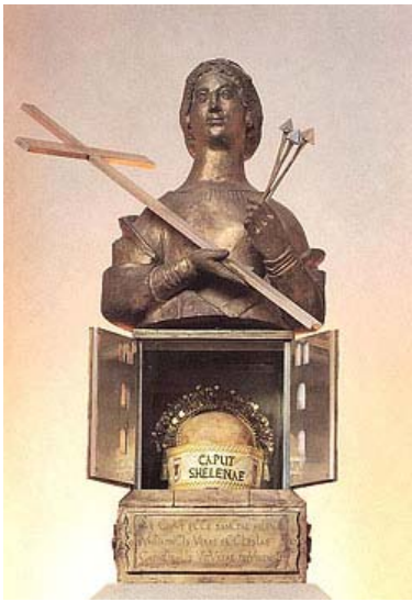
Реликвиарий с мощами св. Елены в Трирском соборе

Старанием святой Елены было разыскано много святых реликвий, в том числе и хитон Иисуса Христа. В Константинополь она возвращалась с частью Животворящего Креста Господня и найденными вместе с Крестом гвоздями, которыми было пригвождено Тело Господа. Один из этих гвоздей сегодня находится в Кафедральном соборе святого Петра в Трире.