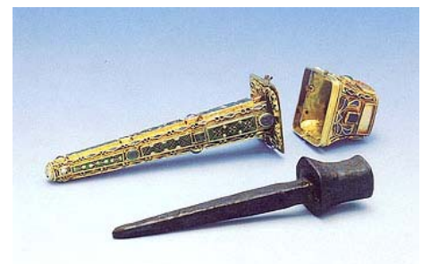
Гвоздь, привезенный святой Еленой из Иерусалима

В 337 г. Константин почувствовал приближение смерти. Всю жизнь он мечтал креститься в водах Иордана, но политические дела мешали этому. Теперь, на смертном одре, больше откладывать было нельзя, и перед смертью его крестил Евсевий Кесарийский. 22 мая 337 г. император Константин I скончался. Прах его погребён в Апостольской церкви в Константинополе. Церковные историки нарекли Константина Великим и провозгласили его образцом христианина.